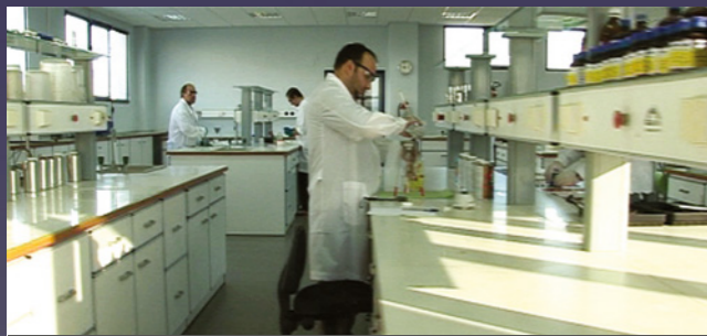
Лаборатория для проведения исследований, новых разработок и контроля качества продукции. Площадь - 3 200 м 2