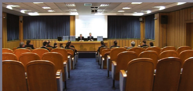
Конференц-зал на 120 человек