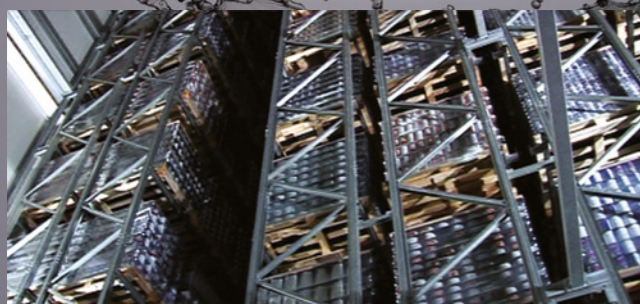
Автоматический накопитель тары на 7 000 поддонов