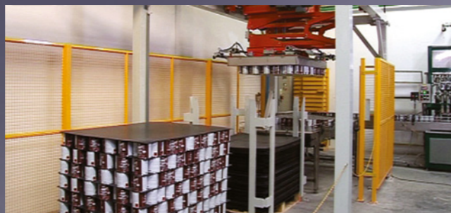
Производственный участок. Площадь цеха - 40 000 м 2