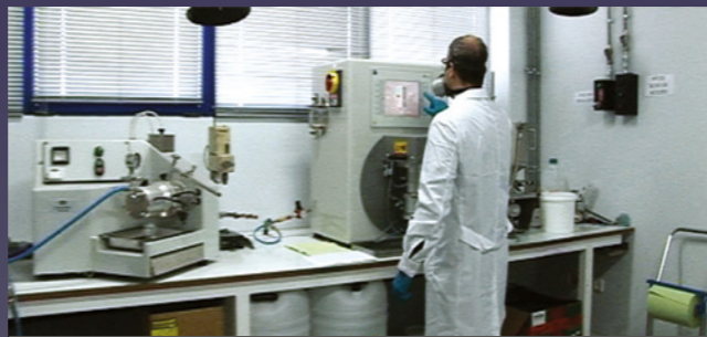
Лаборатория для проведения исследований, новых разработок и контроля качества продукции. Площадь - 3 200 м 2