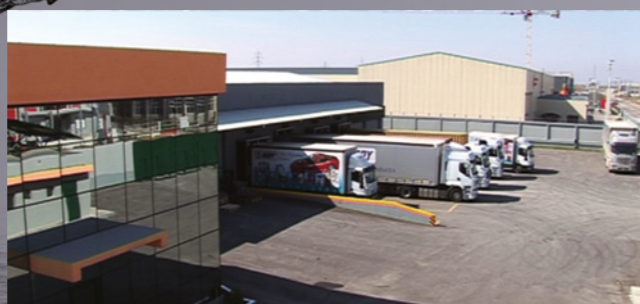
Складской центр площадью 11 000 м 2