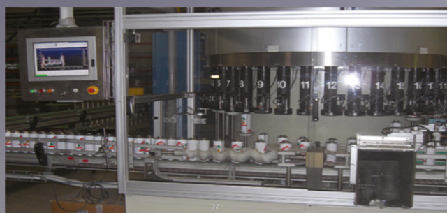
Автоматизированный цех по производству тары площадью 6 000 м 2