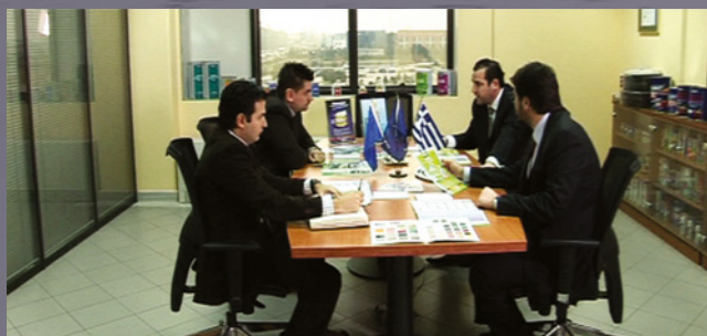
Отдел продаж. Количество сотрудников - 32 человека