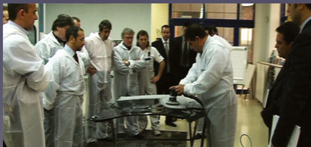
Учебный центр с современным оборудованием