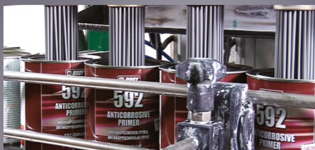
Производственный участок. Площадь цеха - 40 000 м 2