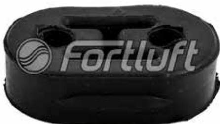
Резинка глушителя подвесная