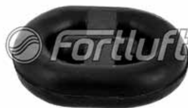
Резинка глушителя подвесная