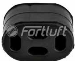
Резинка глушителя подвесная