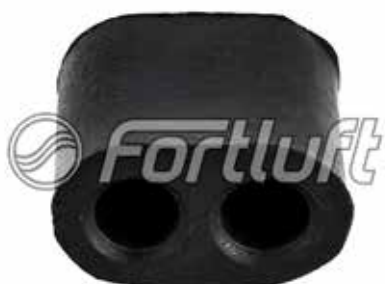
Резинка глушителя подвесная