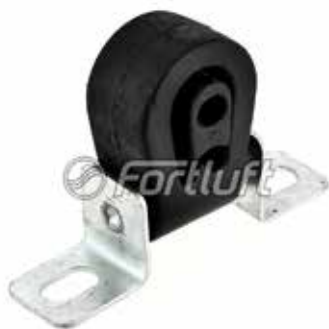
Резинка глушителя подвесная