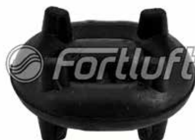
Резинка глушителя подвесная