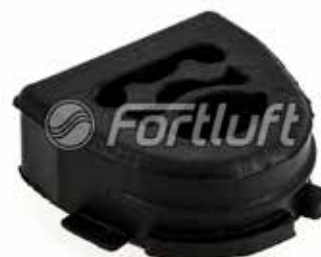
Резинка глушителя подвесная