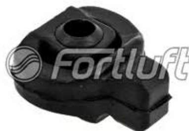
Резинка глушителя подвесная