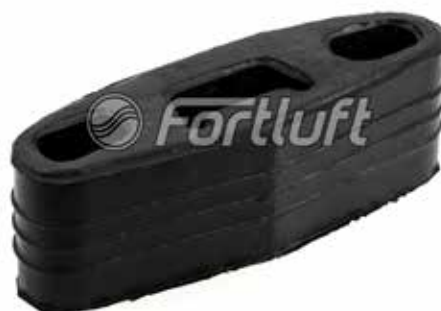
Резинка глушителя подвесная