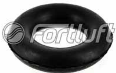
Резинка глушителя подвесная