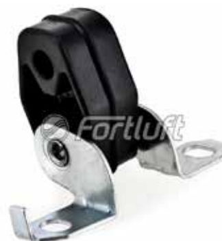
Резинка глушителя подвесная