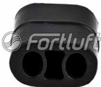
Резинка глушителя подвесная