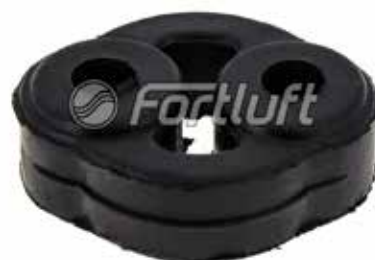
Резинка глушителя подвесная