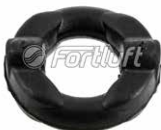
Резинка глушителя подвесная