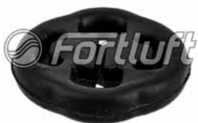
Резинка глушителя подвесная