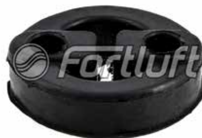
Резинка глушителя подвесная